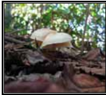
Clitocybe aff. gibba