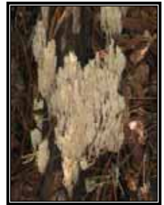
Ramaria aff. stricta