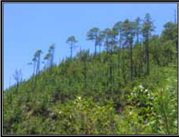
Vista del bosque en recuperación, en donde se nota la presencia de árboles semilleros.

Se observa entonces que el bosque muestra un estrato arbóreo con árboles de 3-5 metros de alto, compuesto por más de dos especies, lo que le da una heterogeneidad y riqueza mayor, además es importante hacer notar que dentro de estas áreas incendiadas quedaron árboles relictuales de talla mayor que ahora están sirviendo como semilleros para el establecimiento del nuevo bosque. De la misma manera, existe un estrato arbustivo y herbáceo bien desarrollado, que permite que el regreso de la fauna silvestre se esté dando paulatinamente, lo que representan buenas señales en la recuperación de la biodiversidad en su conjunto, sin alteración externa.