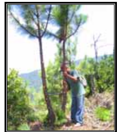
Trabajos de poda son necesarios para el buen desarrollo del bosque.

Una observación importante con relación al bosque en recuperación, es la necesidad de manejo que este presenta en cuestiones de aclareo y poda de los árboles, toda vez que su porcentaje de supervivencia es muy alto y la distancia entre árboles es mínima. Es necesario hacer una selección de los mejores individuos y los más vigorosos y eliminar los restantes para permitir que los árboles seleccionados crezcan libre y vigorosamente. Del mismo modo, los trabajos de poda estimulan el crecimiento del tronco y evitan el desperdicio de energía en ramas laterales bajas.