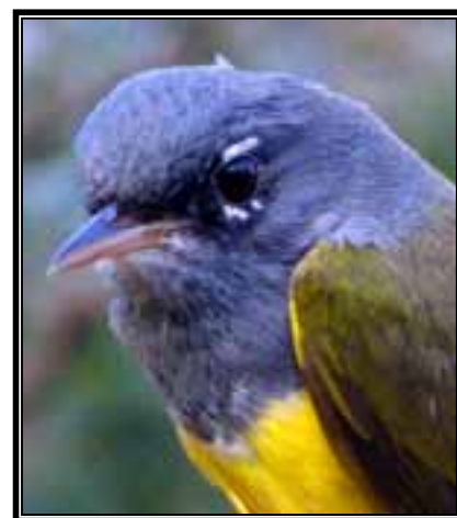
Oporornis tolmiei , especie migratoria y Amenazada.

El territorio de San Martín, además de albergar especies de aves residentes también es una zona importante en la que las aves migratorias tanto del norte de nuestro país, como de países como Alaska, Canadá y Estados Unidos, las cuales tienen grandes periodos de estancia en estos territorios.