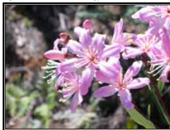
Bejaria aestuans , arbusto bajo de flores llamativas, común en el bosque de Pinus.

Bosque de Pinus , que se encuentra dominado principalmente por Pinus patula en algunas zonas y por Pinus oocarpa en otras zonas. En algunas zonas es posible encontrar a Pinus pseudostrobus y Pinus ayacahuite , en compañía de diferentes especies de encino y de Clethra mexicana y Alnus jorullensis . En estratos inferiores es posible encontrar a Arbutus xalapensis , Comarostaphylis discolor , Bejaria aestuans , Sambucus nigra ver. canadensis , Litsea glaucescens , Monochaetum floribundum , Baccharis conferta , roldana angulifolia , etc.