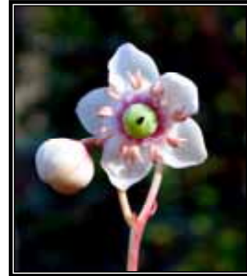
Chimaphila maculata (Ericaceae), herbácea presente en el bosque de Quercus .