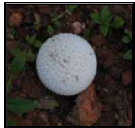
Lycoperdon aff. candidum