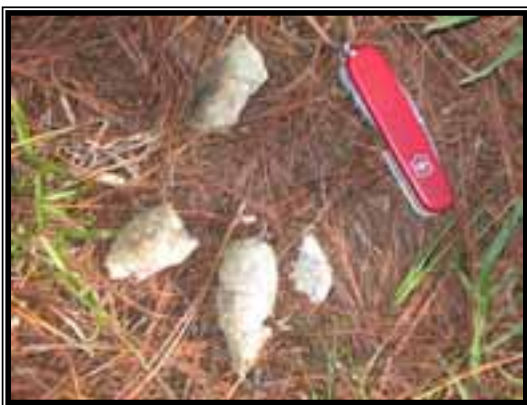
Registro fotográfico de excretas de puma ( Puma concolor ).

Para el muestreo de mamíferos, éste se realizó utilizando el método indirecto del rastreo, basado en la búsqueda de cualquier indicio dejado por un animal, ya sean huellas, excretas, rascaderos, echaderos, senderos, madrigueras, restos orgánicos, desechos de alimentación, señas de ramoneo, voces y sonidos, olores, entre otros, así como avistamientos directos. De esta manera, en los transectos se fueron buscando rastros, los cuales fueron fotografiados y cuando era posible (huellas o excretas) fueron colectados. Para la colecta de huellas se utilizaron moldes de yeso odontológico y para las excretas bolsas de plástico resellables.