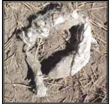
Excreta de coyote ( Canis latrans ), con restos de una bolsa de plástico.

Una más de nuestras observaciones en campo, fue respecto a la gran cantidad de basura que se encontró en el bosque, sobre todo en botellas de plástico o PET. También encontramos basura perteneciente a los camiones que sacan la madera, como son restos de llantas, filtros, botellas de aceite, baterías de carro, etc. Esta basura causa muchos problemas, sobre todo a la fauna silvestre, ya que si los plásticos son consumidos por ellos en su búsqueda de alimento, puede causarles la muerte. Además, la basura causa contaminación visual a los bosques tan bien conservados con los que cuenta la comunidad.