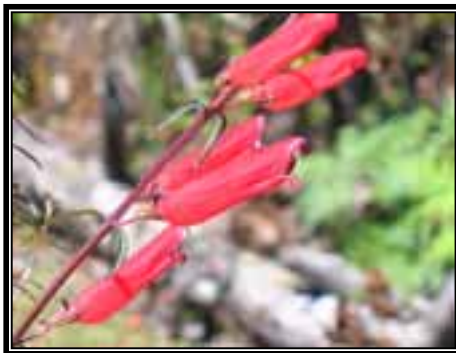
Lamourouxia sp., herbácea presente en el bosque de Pinus .