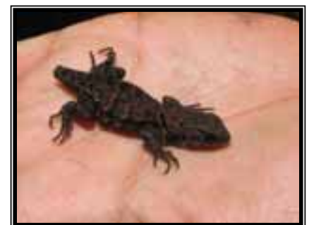
Lagartija ( Sceloporus sp.), registrada fotográficamente.

Se registraron en total tres especies de reptiles y ninguna de anfibio. Estas especies fueron dos de lagartija, Sceloporus internasalis y Sceloporus sp., así como una culebra no venenosa. Personas de la comunidad nos informaron que Sceloporus internasalis es una especie muy común y abundante en la zona.