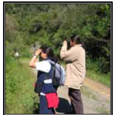
Censos de aves mediante observación con binoculares

La modificación consistió en no considerar puntos con estimaciones de un tiempo determinado y siguiendo los caminos designados para el recorrido. Los censos visuales se efectuaron con la ayuda de binoculares (8X23 y 7X50 mm); para el registro de cantos y llamados en los censos auditivos se contó con una grabadora digital. Los censos fueron realizados tanto en los transectos como en el pueblo, en las mañanas y tardes.