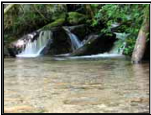
Arroyo de aguas cristalinas.

En cuestiones hidrológicas, los arroyos visitados se observaron limpios y de aguas cristalinas, lo que habla también del estado de conservación del bosque. Las aguas claras nos indican que los trabajos de conservación de suelo están funcionando y que el establecimiento tanto de la reforestación como de la regeneración natural están cumpliendo su trabajo de retención de suelo, por lo que no se observa pérdida de suelo por erosión.