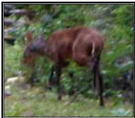
Venado temazate ( Mazama americana ) reportado en bosque de Pinus .

De manera general, el registro de 16 especies que destacan por su endemismo o su calidad de protección de acuerdo a la NOM-059-SEMARNAT-2001 en un recorrido de dos días por el territorio de San Martín Buenavista son buenos indicadores de que los bosques se encuentran en franca recuperación, tomando en cuenta que estas especies son indicadoras sensibles tanto de la riqueza biológica como de la salud del ambiente.