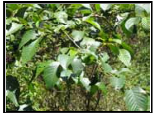
Palo de águila ( Alnus jorullensis ), posible especie para reforestación.

En el contexto de la restauración de los bosques, y aún y cuando ésta se está realizando con las especies nativas del área, sería importante realizar las acciones de reforestación con algunas otras especies que no sean aprovechables desde el punto de vista forestal, pero que sí contribuyan a la regeneración y restauración del bosque. En este sentido, se recomienda el uso del palo de águila ( Alnus jorullensis ), madroño ( Arbutus xalapensis ), tepozán ( Buddleja cordata ), entre otras especies nativas importantes.