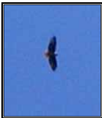
Registro de Aguililla cola roja ( Buteo jamaicensis ) al vuelo.

Del total de 54 especies registradas, 52 de ellas son residentes y solo el “vencejo negro” ( Cypseloides niger ) es una especie migratoria de verano. Vale la pena mencionar que 16 especies son de importancia particular por su endemismo (es decir, que sólo se localizan en esta región y en ninguna otra parte del país o del mundo) o por su situación de protección de acuerdo a la Norma Oficial Mexicana 059-SEMARNAT-2001.