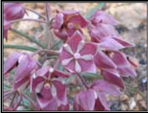
Asclepias sp., herbácea que crece en los bosques de pino y encino.

Bosque de Quercus , el cual se encuentra conformado principalmente por diferentes especies de Quercus , entre ellas Quercus castanea , Quercus crassifolia y Quercus sp. También es posible encontrar a Arbutus xalapensis , Clethra mexicana , Buddleja cordata , Chimaphila maculata , Fuchsia thymifolia , Lamourouxia sp., Bdallophytum americanum , Tillandsia violacea , Tradescantia sp., entre otros.