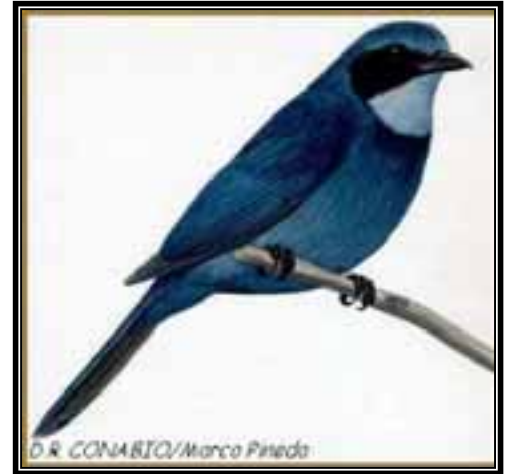
Chara enana ( Cyanoliza nana )

Otras especies endémicas con menos probabilidad de ser escuchadas u observadas, pero que se registraron en el área son el “trogón mexicano” ( Trogon mexicanus ), el “mulato azul” ( Melanotis caerulescens ), la “parula ceja blanca” ( Parula superciliosa ), el “chipe gorra rufa” ( Basileuterus rufifrons ), el “chipe ceja dorada” ( Basileuterus belli ), el “atlapetes gorra rufa” ( Atlapetes pileatus ) y el “pico grueso encapuchado” ( Coccothraustes abeillei ).