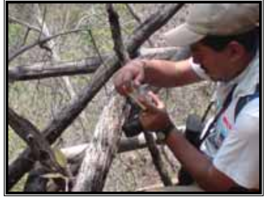
Toma de fotografías de los organismos encontrados.

En el muestreo de la flora y la vegetación, fueron colectadas plantas por duplicado. En este caso, solo se colectaron plantas que se consideraron relevantes desde el punto de vista de su rareza, belleza o importancia ecológica. En el caso de la vegetación, a lo largo de los transectos se tomaron notas de las especies dominantes y características de cada tipo de vegetación, así como también los estratos existentes. En el caso de que alguna de estas especies fuera desconocida, también era colectada. Las colectas realizadas fueron prensadas entre periódicos y cartones, secadas en secadora de focos y desinfectadas por congelación. Posteriormente fueron determinadas taxonómicamente, etiquetadas y donadas al herbario CORU de la Facultad de Ciencias Biológicas y Agropecuarias de la Universidad Veracruzana Campus Peñuela.