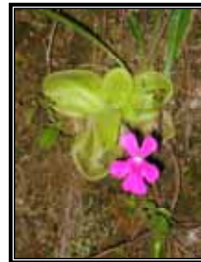
Pinguicula moranensis , herbácea insectívora creciendo en las paredes de los bosques mesófilos de montaña.