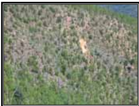
Vista de algunas zonas afectadas por derrumbes, en donde son necesarios trabajos de conservación de suelos.

Otra práctica de manejo que es importante realizar en el área, es el continuar con los trabajos de conservación de suelo que se están realizando, pero que aún son necesarios debido a que se observan algunas pequeñas zonas afectadas por el derrumbe o deslavamiento de tierras sobre todo en terrenos con laderas pronunciadas y que ahora, en la época de lluvias, representan graves peligros de pérdida de suelo en el bosque.