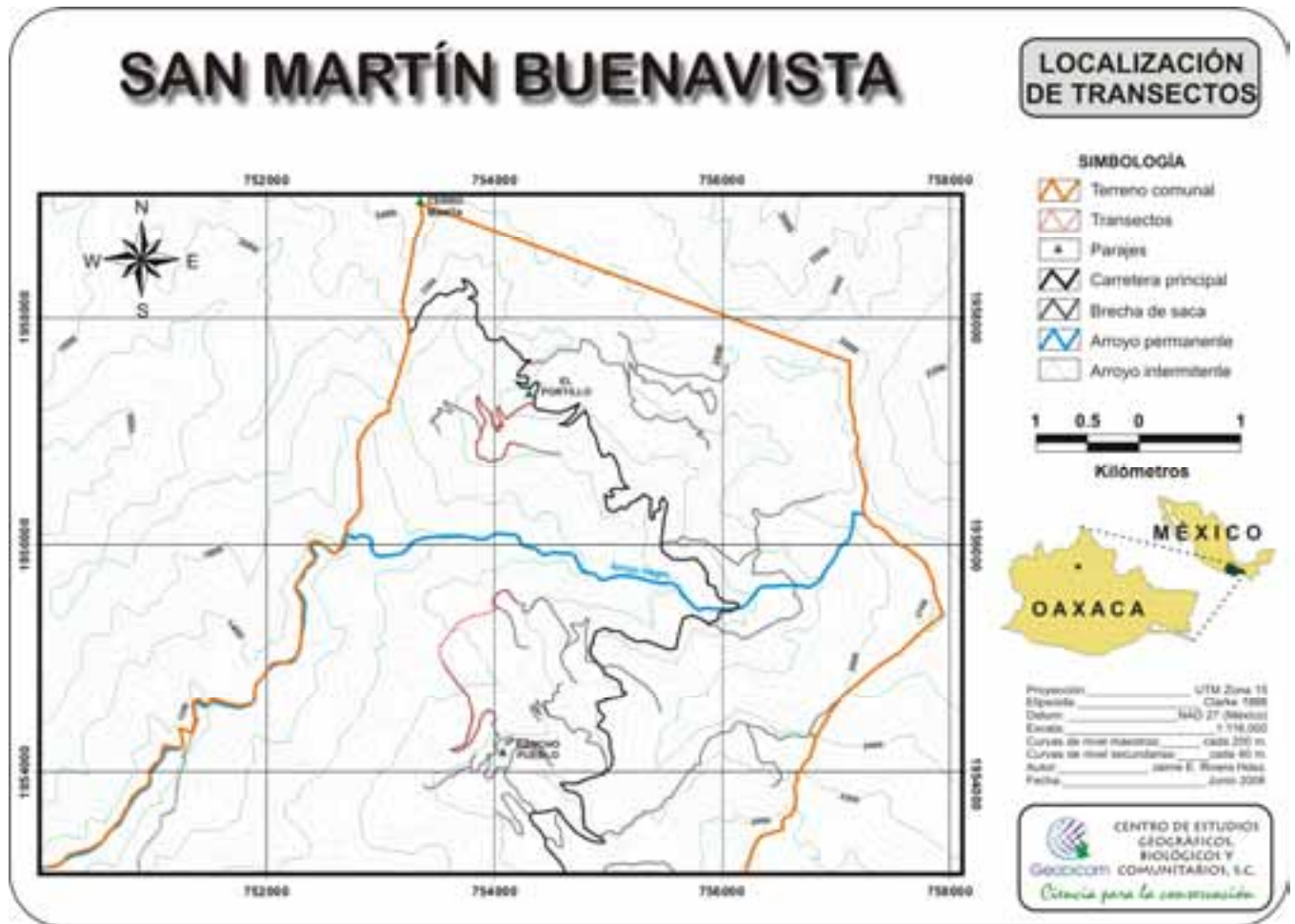
Figura 1. Localización del área de estudio y de los transectos realizados.

Se realizaron dos transectos en la parte norte del territorio de San Martín Buenavista. Estos transectos fueron realizados principalmente a través de brechas de saca forestal, aunque también se caminó a través del bosque. Los transectos se realizaron en bosques de pino y bosque mesófilo de montaña. Adicionalmente se realizaron caminatas a través de bosques de pino-encino y bosque de encino. Los transectos fueron cartografiados y son mostrados en el mapa de la figura 1.