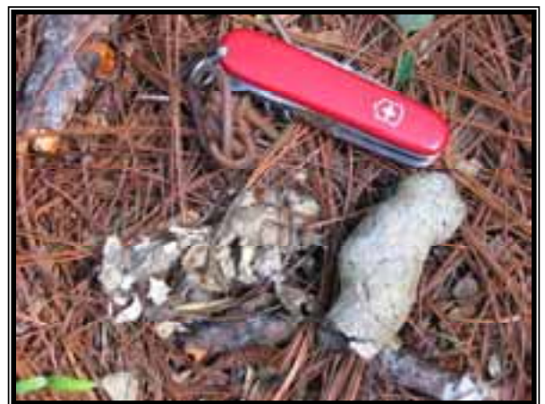
Excreta de coyote ( Canis latrans ), con restos de una ardilla ( Sciurus aureogaster ).

En este rubro, logramos el registro de siete especies de mamíferos, los cuales fueron, la ardilla gris ( Sciurus aureogaster ), el tejón o coatí ( Nasua narica ), la zorra gris ( Urocyon cinereoargenteus ) el venado temazate ( Mazama americana ), el venado cola blanca ( Odocoileus virginianus ), el puma ( Puma concolor ) y el coyote ( Canis latrans ). De estas especies, el puma se encuentra dentro de la categoría NT (near threatened, en español, cerca de la amenaza) en la Lista Roja de la UICN (Unión Internacional para la Conservación de la Naturaleza).