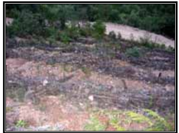
Trabajos de conservación de suelo en el área.

Por otra parte, los trabajos de conservación de suelo que se están llevando a cabo en el área, resultan muy importantes y de mucho beneficio, ya que permiten que las áreas afectadas por el incendio no pierdan suelo y nutrientes por erosión, y de esta manera, se permita el establecimiento de la regeneración natural y de la sucesión de especies.