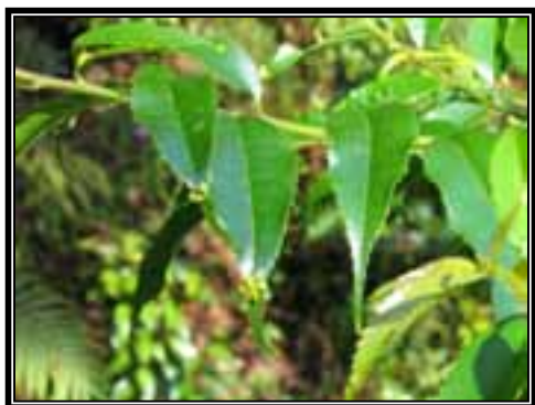
Phyllonoma laticuspis , planta arbustiva propia de los estratos inferiores del Bosque Mesófilo de Montaña

En cuanto a la vegetación, se visitaron tres tipos principalmente, los cuales se describen a continuación: