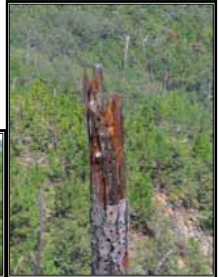
Troncos muertos derribados y en pie que evidentemente son utilizados por la fauna silvestre.