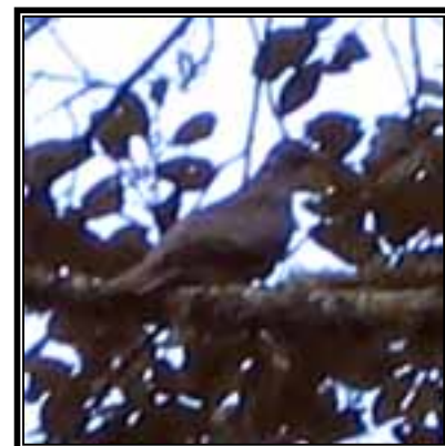
La paloma de collar ( Patagioenas fasciata ) encontrada sobre un encino.

Entre las primeras especies con altas probabilidades de ser observadas o escuchadas, tanto en el pueblo como en los recorridos, se encuentran el “toquí oaxaqueño” ( Pipilo albicollis ), el “jilguero encapuchado” ( Carduelis notata ) y el “colibrí berilo” ( Amazilia beryllina ), la cual notamos que es utilizada como símbolo de buena suerte en una tienda de abarrotes del pueblo.