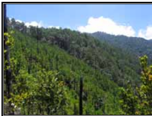
Vista panorámica de área afectada por incendio, que actualmente está en recuperación tanto por regeneración natural como por reforestación.

En cuestiones de restauración de los bosques, es evidente que el proceso de recuperación del bosque va por buen camino. La mezcla tanto del trabajo de restauración por la mano del hombre, en combinación con la regeneración natural ha dejado frutos que a la fecha son fáciles de observar. Adicionalmente, las actividades que la comunidad ha efectuado en el lugar tales como son el no realizar trabajos de saca de madera muerta en la zona, junto con los trabajos de reforestación, han permitido el establecimiento de la regeneración natural con especies nativas, de forma tal que el bosque no se vuelva una plantación comercial, que nada tiene que ver con el bosque original y con su biodiversidad.